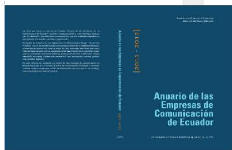
Ilustración 1 Portada Anuario

La presentación de los resultados obtenidos a través del modelo metodológico se realizó en formato impreso y digital. Como se señaló, el “Anuario de las Empresas de Comunicación de Ecuador 2011-2012” actualmente está disponible en forma física como digital 13 .