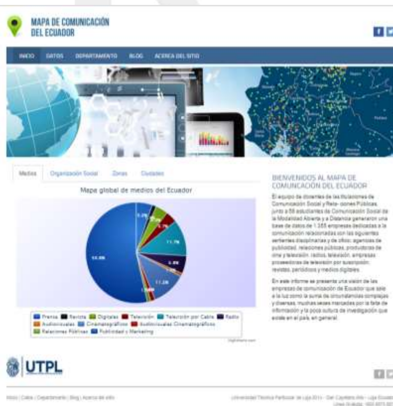
Ilustración 2 Web del Mapa de Comunicación del Ecuador