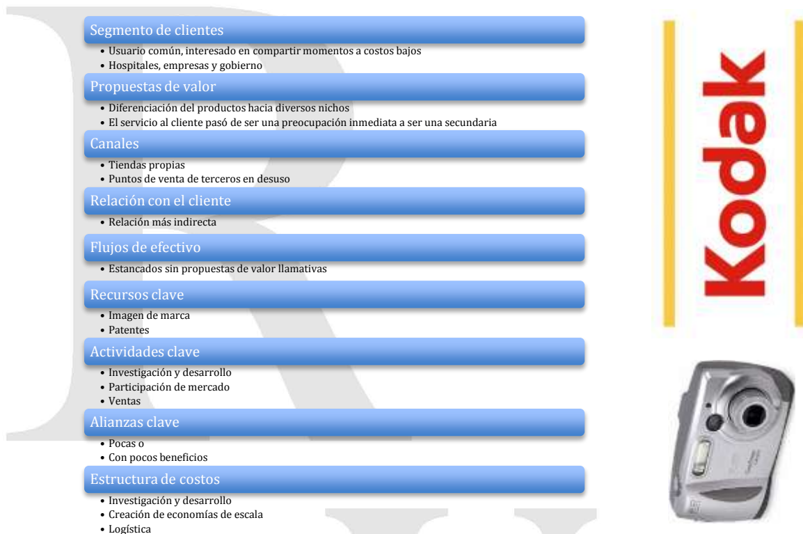
Fig. 3. Modelo de Negocio Kodak Etapa 2

La estrategia con respecto a los procesos internos de la empresa que define los factores diferenciales de la creación de valor en Kodak, durante la segunda etapa, con base en el análisis fundamentado en Osterwalder (2010) presenta las siguientes características: