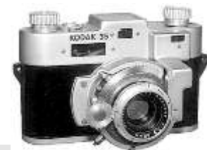
Fig. 2. Modelo de la Empresa Kodak Etapa 1

La estrategia con respecto a los procesos internos de la empresa que define los factores diferenciales de la creación de valor en Kodak, durante la primera etapa, con base en el análisis fundamentado en Osterwalder (2010), presenta las siguientes características: